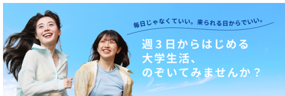
新・通学スタイル「スマカレ(smart custom-made college)」

専門教育とリベラルアーツ教育を、対面授業とオンデマンド授業を組み合わせる学び、3日間の通学で卒業できる設計です。この3日間は学校生活に慣れるための「助走期間」となります。毎日登校のプレッシャーを取り除きながら、卒業に必要な知識とスキルが確実に積み上げられます。残りの2日間は、自分で自由に設計することができます。疲れたなら休む。そして、少しずつ余裕が生まれてきたら、この2日間を通学に切り替え、段階的に通学日数を増やすことも可能です。もちろん、通学ではなく、趣味やアルバイト、芸能活動などに充てることも自由です。学生自身が最適なペースを保ちながら社会生活へ接続できるよう、支援していきます。